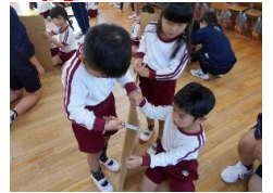
「みんなで協力して 切ろうね・・・」

運動会で楽しんだ「忍者」の世界で、11月はお店屋さんごっこをしました。4歳児ばら組はいろいろな食べ物屋さんを、5歳児ほし組はゲームランドを、子どもたちが試行錯誤を繰り返しながら遊びを作り上げていきました。