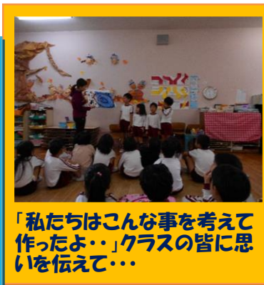
「私たちはこんな事を考えて 作ったよ・・・」クラスの皆に思 いを伝えて・・・