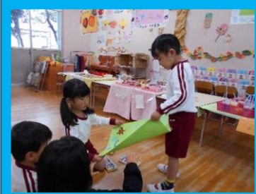
お店の看板もみんなで描いたよ!