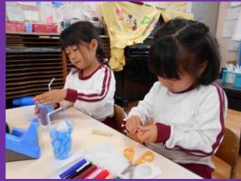
「忍者印のジュースも作ろう！」