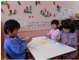
「忍者のお団子 作ろう！」