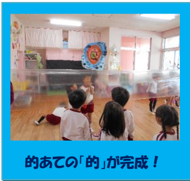
的あての「的」が完成！

毎日、遊んだり、作ったりしては活動を振り返り、話し合いや相談を重ねてきました。クラスでお店側とお客側に分かれて遊んだり、異年齢・未就園児・お家の人・保育園の友達にお客さんになってもらって遊んだりする中で、遊び方を丁寧に分かりやすく伝えるための工夫や、お客さんが楽しんで遊べるためのルールや場所づくりをクラスのみんなで考えていきました。