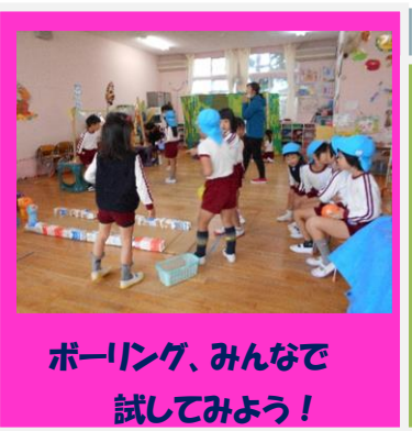
ボーリング、みんなで 試してみよう！