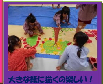
大きな紙に描くの楽しい！

2人組で協力したり、4～5人で 思いを出し合ったり、また、クラス の皆で話し合い、遊びのルールを 考えたりしながら活動を進めて いきました。