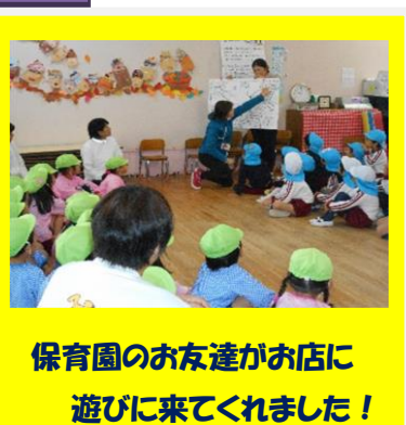
保育園のお友達がお店に 遊びに来てくれました！