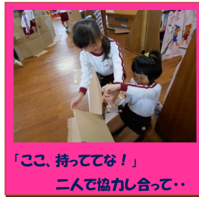
「ここ、持っててな！」 二人で協力し合って・・・