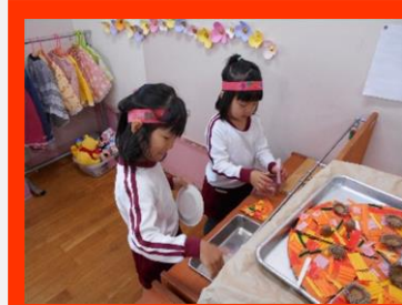
ピザ屋さんの厨房ではちゃんと洗い物もしています・・・!