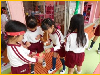
「ほし組さん、これいかがですか～」

「いらっしゃいませ」「少々お待ちください」「何にしますか?」「温かいのと冷たいの、どちらがいいですか?」「これ、おすすめです!」等等・・・普段の生活で見聞きしている事が、遊びの中にたくさん出てきました。いろいろな人との関わりを通して、相手に伝えられた、喜んでもらえたという自信を感じることが出来ました。