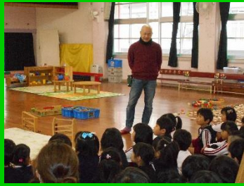
たくさんのおもちゃを前にワクワク！

宇治市にあるおもちゃのお店、「キッズいわき」さんによる、おもちゃライブラリーを開催しました。在園児だけではなく、来年度幼稚園に入園するお友達も大勢遊びに来てくれました。