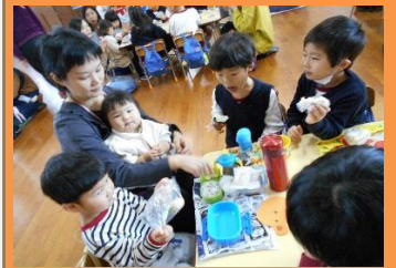
遊んだ後は、未就園児さんと 一緒に おにぎりランチ♪

夢中になれて、満足感や達成感を味わえるおもちゃ、人とのコミュニケーションを楽しめるおもちゃ、指先を使って、思考力や忍耐力が養われるおもちゃ等、子どもたちに今、遊んでほしいと思う物にたくさん出会うことが出来ました。大切な幼児期にどんなおもちゃに出わせてあげるか・・・考えていきたいですね。