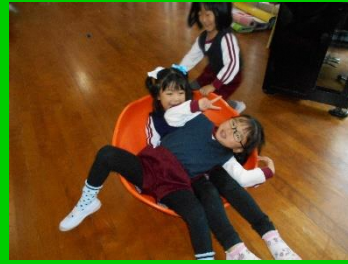
わぁ～何だか楽しい～！