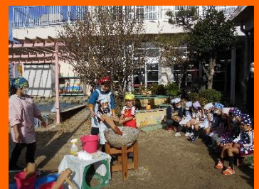
交代でお餅をつきました。 「杵って結構重いなぁ～！」