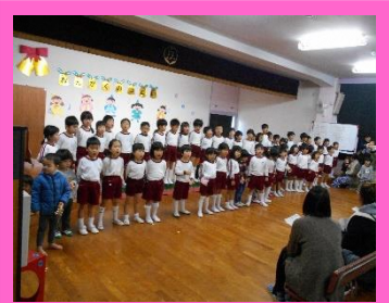
最後は弟妹の皆も一緒に歌いました

幼稚園では、上手に歌ったり、楽器を鳴らしたりすることが目標ではなく、「歌うことが楽しい、気持ちいい！」 「いろんな音があるね・・」「こんな音が素敵！」「リズムにのって踊るのが楽しい！」そんな風に生活の中で音楽を楽しんでほしい、音楽が身近な物になり、好きになってほしいと願っています。今後も日々の保育の中で、子どもたちが楽しみ、好きになれる歌や曲に出会わせてあげたいと思っています。