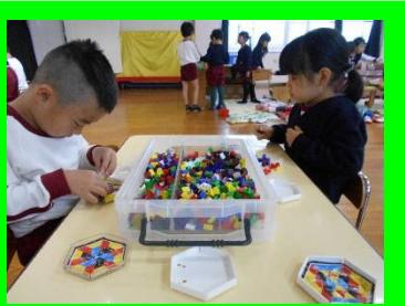
約1時間半、みんな 夢中で遊びました！