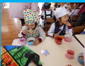
つきたてのお餅は、おぜんざいに して頂きました。

家庭ではなかなか体験できない昔ながらのお餅つき。PTAの役員の方や保護者の方のお手伝いのおかげで行うことが出来ました。かまどの火や蒸しあがったばかりのホカホカの白蒸し、つきたてのお餅のおいしさ・・・たくさんの事を見たり、感じたり出来る実体験はこれからも大切にしていきたいです。