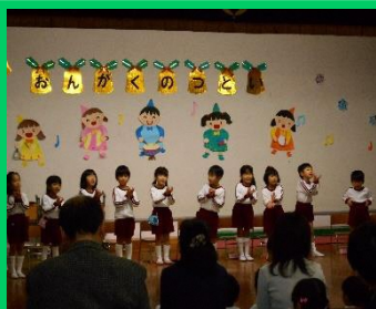
ばら組さんは初めての音楽の集い