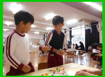
ゲームに夢中になる年長組さん・・・