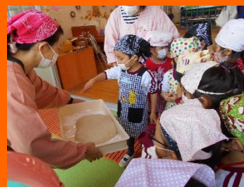
「わぁ～すごい！」 つきたてのお餅に感激！！