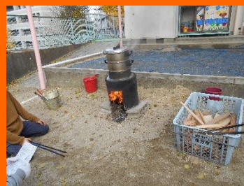
「何だか煙の匂いがある・・・」 かまどから立ち上る湯気や煙に 興味津々・・・

おぜんざいは食べられるかな・・・と少し心配でしたが、喜んで食べている子が多く、特に年長組の子どもたちには「おかわりある？」「もっと食べたい！」と大人気でした！