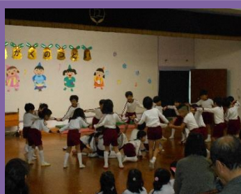
誰とでもすぐに手を繋げるって素敵！