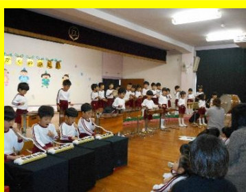
ほし組は、交代して2つの楽器に挑戦！