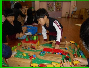
木のレールと木の汽車で・・・