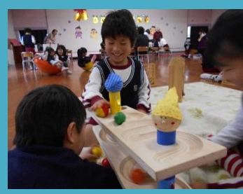
球が転がっていくおもちゃ、 何回やっても楽しい！