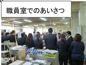
職員室でのあいさつ