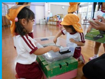
「かわいいね、泳いでるね！」