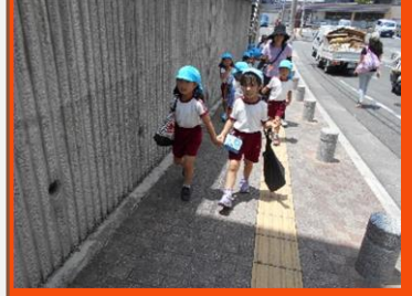
帰り道、エコバッグに入れた人参やお肉が重くても何のその！