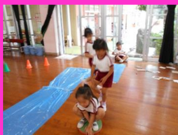
「ケロケロ！こっちに行くケロ」