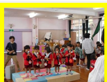
ステージでマイクを持って歌ったよ