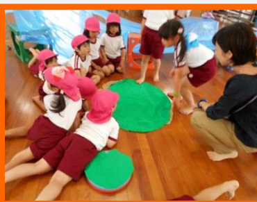
オタマジャクシさん、いらっしゃい！