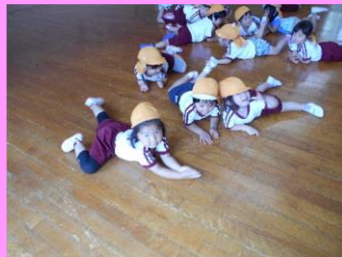
「お池の中を泳いでるの！」