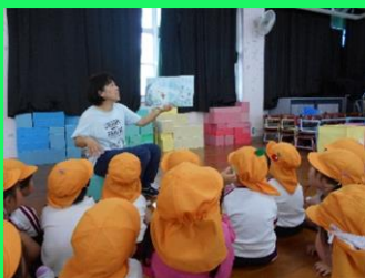
「おたまじゃくしの101ちゃんの絵本をみんなで見ました。」