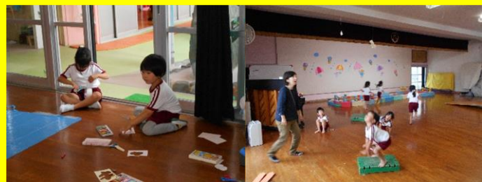
「カエルが食べる虫を作ろう・・・」

積み木やビニール、いろいろな遊具をカエルの住む池や田んぼの世界に見立てて、ごっこ遊びが始まりました・・・