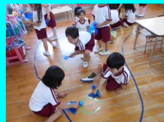
「こんにちは、一緒に泳ごう！」