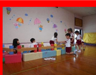
「ここはカエルの家にしよう・・・」

「ここは葉っぱが浮いてるところ」「ここがカエルの家やで！」「カエルは虫を食べるから、虫を作って飛んでるみたいにここにぶら下げたい！」