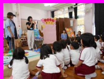
「明日はこんなお店があるよ・・・」