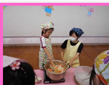
具材をいれたお鍋をかき混ぜて・・・