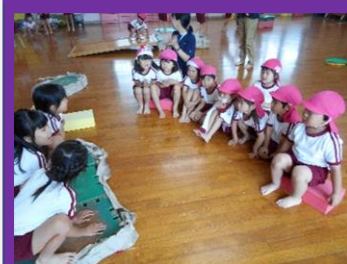
カエルのコンサートをオタマジャクシが聴きにきてくれました♪

3歳児や4歳児もごっこ遊びに加わり、様々な関わりも生まれました。幼児期にしか味わえない、イメージの世界で遊ぶ楽しさを、これからもたくさん経験してほしいと願っています。