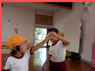
「この虫が探りたいの？」