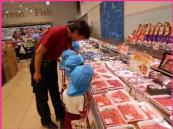
「牛肉はどれですか？」