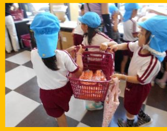
普段、お家の人がしている事をよく見ているのが分かりました・・・