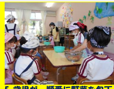
5歳児が、順番に野菜を包丁で切りました。