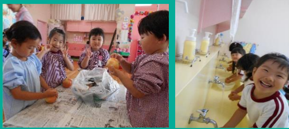
4歳児は皮むき、3歳児はじゃがいもを洗うお手伝い！！

幼稚園で収穫したじゃがいもを使ってカレーパーティーをしました。足りないものはおおさかパルコープさんにご協力頂き、5歳児全員でお買い物に・・・みんな大張り切り！！分からないことはちゃんとお店の方に尋ね、「明日、カレーパーティーをするんです」「みんなの分をほし組が作るの！」等と伝える姿も・・・3歳児、4歳児の子どもたちも自分たち出来るお手伝いをして、参加しました。