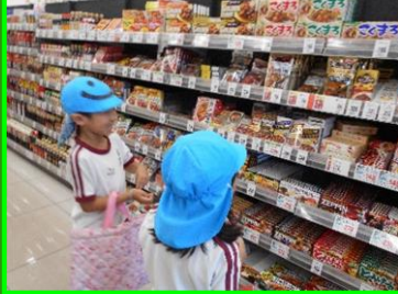
どれだろう？・・・ずいぶんと悩みました