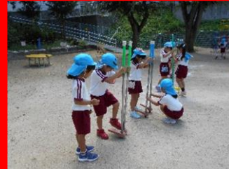
5歳児は竹馬に挑戦！