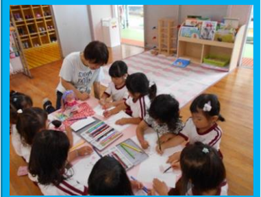
「こんな服が似合うと思う！」 デザイン画を描く子ども達・・・