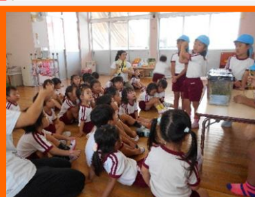
「どうやって虫を捕まえたの？」