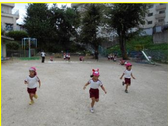
「よーいドン！」 走るの気持ちいいね！

涼しくなり、体を動かすには最適の季節になってきました。歩く・走る・渡る・跳ぶなど、生活の中でも欠かせない動きを、遊びの中でたくさん経験することで、しなやかで丈夫な体を作ってほしいと願っています。また、特に5歳児の子どもたちには、自分なりのめあてを持って、少し根気がいることにもチャレンジしてほしいと思っています。