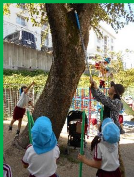
「木の上に何かある！」 「先生、取ってみて！」