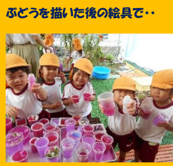
ぶどうを描いた後の絵具で・・・