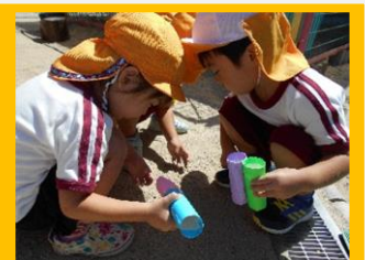
双眼鏡や望遠鏡を持って、宝探しが始まりました！

園庭にキラキラ光る石が落ちていたり、宝の地図が見つかったり・・・何だか不思議なことが幼稚園で起こっています。子どもたちはドキドキ、ワクワク・・・もしかすると、これからみんなで宝島を目指すことになるかもしれません！