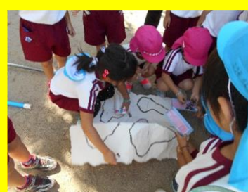
「これは地図だ！」「ここに、宝物みたいなのが描いてある！」