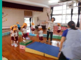
細い道を落ちないように歩いたり、ジャンプをしたり・・・

涼しくなり、体を動かすには最適の季節になってきました。歩く・走る・渡る・跳ぶなど、生活の中でも欠かせない動きを、遊びの中でたくさん経験することで、しなやかで丈夫な体を作ってほしいと願っています。また、特に5歳児の子どもたちには、自分なりのめあてを持って、少し根気がいることにもチャレンジしてほしいと思っています。