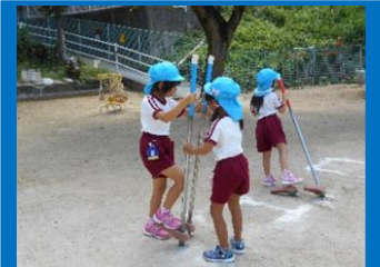
頑張っている友達の気持ちに寄り添って・・・ 「とうとう、その調子！」