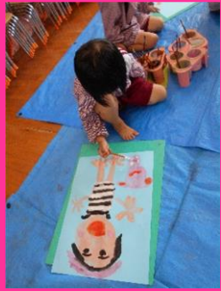
「フールで遊んでる私、描いたよ！」