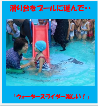
滑り台をプールに運んで・・・

まだまだ残暑が厳しい中、9月2日に幼稚園の2学期が始まりました。初めの週はプール遊びをし、夏休みの間に得意になった顔付けを披露する子、ウォータースライダーで大はしゃぎする子・・・今年最後のプールを満喫しました。最終日には水の妖精がやってきて・・・みんなにメダルをプレゼントしてくれましたよ！