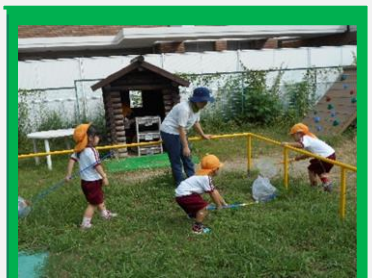
「虫捕りしてみたい！」