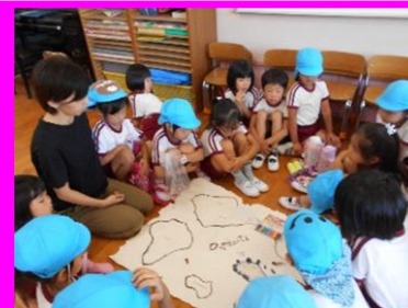
「ここがアメリカで、ここは日本？」 「ここには海賊みたいな船がある！」