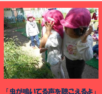
「虫が鳴いてる声を聴こえるよ」