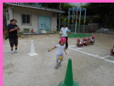
ボールを挟んでジャンプをしながら進めるかな・・・