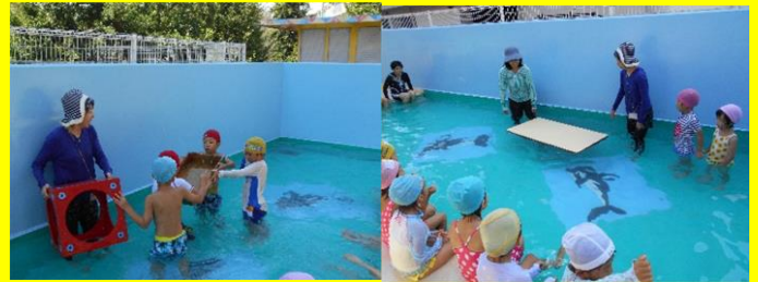
「これもやってみよう！」

5歳児がプールの中で大実験をしました。 「これは浮く？沈む？」自分なりに予想を立てて、いろいろな物をプールに入れて試してみたのです。沈むであろうと思っていた大きな机が浮くなど、驚きもいっぱい！生活や遊びの中でこんな好奇心や探求心をくすぐられる経験を、たくさん積んでいけたらと思います。