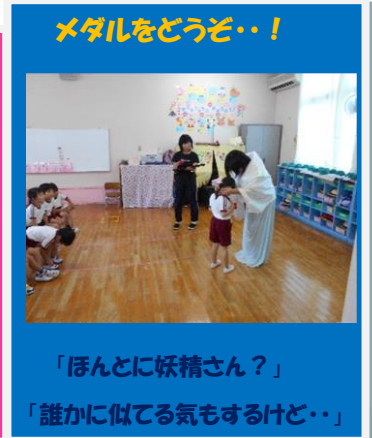
メダルをどうぞ・・・!