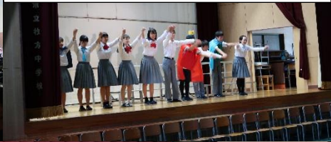
生徒会執行部の演劇による諸注意