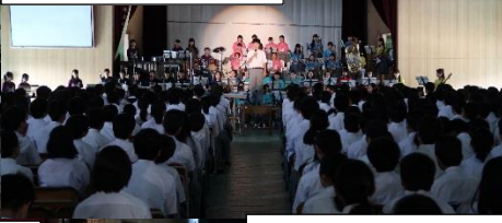
生徒会長あいさつ