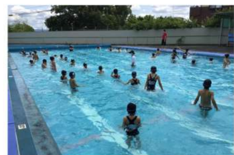
3年生の水泳指導です。2クラスずついつもの半分の人数で実施です。