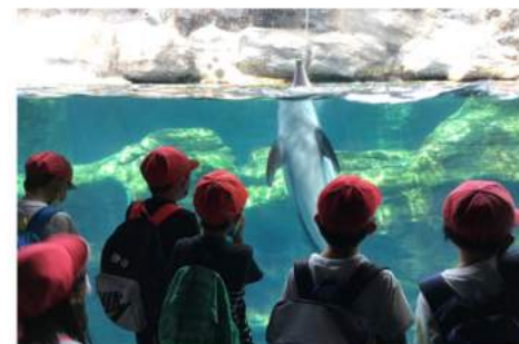
2年生の遠足は海遊館です。太平洋を一周します。カマイルカがお出迎えです。