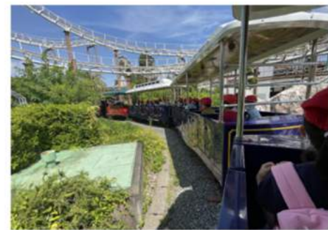
1年生の遠足はひらかたパークです。友だちと楽しく過ごし、乗り物にものりました。

地域の皆様には、日頃から「見守り隊」の活動を始め、様々な形で本校の教育にご支援を頂き、本当にありがとうございます。 明治六年(一八七三年)に創立した本校は、いよいよ本年度一五〇周年を迎えます。校区コミュニティの皆様、元PTAの皆様、現PTAの皆様のお力をお借りして、記念のイベントや式典、音楽体験やパンサーズとの交流、オリジナルの交流、ピアノのユニークな交流、記念事業を着々と進