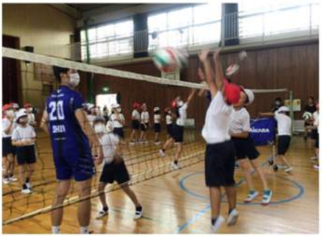
4年生のパンサーズとの交流の様子です。バレーボールの基礎と楽しさを教えてもらいました。