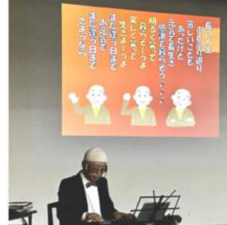
ラストはいつも「星影のワルツ」(替歌)

「HIRAKATAの爺」さんが、令和4年5月2日にご逝去されました。うたごえサロンに多数ご出演していただきました。懐かしい童謡や歌謡曲など一緒に歌ったり、畑で採れた野菜の話など聞きながら楽しく過ごしました。