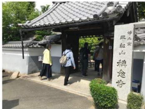
第十三番札所 称念寺