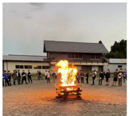
5年生のマキノ高原での宿泊学習です。2日間のプログラムをすべて行いました。