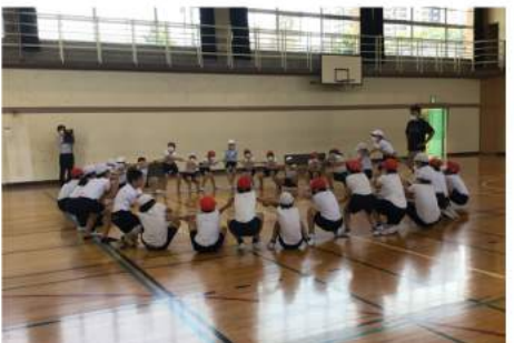
6年生の中学校体験授業の様子です。教科に分かれて授業を受けます。楽しい体育の授業でした。

めていきます。この記念すべき年を、地域、保護者、学校が一つになって、喜び祝う年にしていきたいと思えます。子どもたちにとって思い出に残る事業の一つ一つが、子どもたちが成長したとき、必ず、学校や地域を支える力につながるものと思っています。 コロナの状況については、予断を許さないものがありますが、おかげさまで一学期は対策を講じた上で様々な活動を行うことができました。今後とも、本校の教育活動にお力添えを頂きますよう、よろしくお願いたします。 (学校長 北脇宣至)