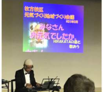
オープニングタイトル