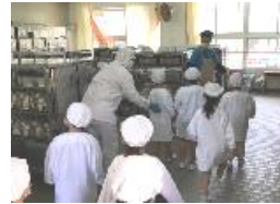
1年生、並んで配膳室へ。